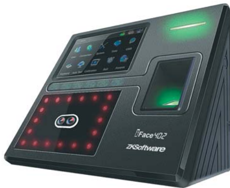
دعم مختلف أنواع أجهزة الحضور

تقارير تفصيلية: تقرير عن موظف لفترة زمنية، تقرير بالفروع والأقسام، ساعات العمل الفعلي، ساعات الحضور، ساعات التأخير.