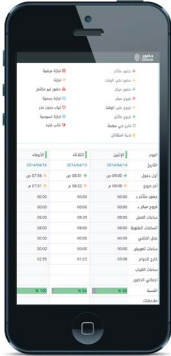
دعم كامل للعرض على الأجهزة الذكية

ومن خلال صفحة ويب خاصة فإنه أصبح بالإمكان متابعة أوقات الحضور، التأخير، والغياب من أي مكان وفي أي وقت. فقد روعي في نظام "حضور" احتياجات الموظف واحتياجات المنشأة، فبإمكان الموظف مراقبة أوقات حضوره، التعديل على نوع الحركة (دخول، خروج) دون تغيير وقت الحركة مما يعطي مرونة للتعامل مع حالات أخطاء اختيار نوع الحركة عند أجهزة البصمة.